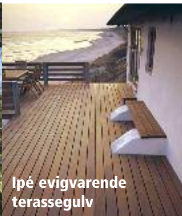
Ipé evigvarende terassegulv