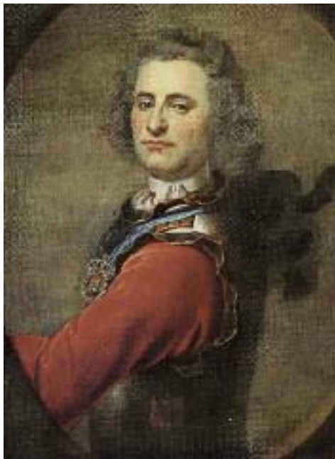
Peter Wessel Tordenskiold

Med disse skutene utførte ganske snart en rekke oppsiktsvekkende bedrifter og gikk seiersrik ut av en rekke konfrontasjoner. Han nølte ikke med å gi seg i kast med en overmakt og nølte heller ikke med å omgå ordrene om han fant det nødvendig. Fienden så på ham med både frykt og respekt, og langs svenskekysten fikk han raskt tilnavnet ”Kattegats skrekke”. I 1715 var han sterkt medvirkende til at danskene tok en god del av den svenske flåten og han selv erobret fregatten Hvide Ørn som snart viste seg å være flåtens raskeste seiler.